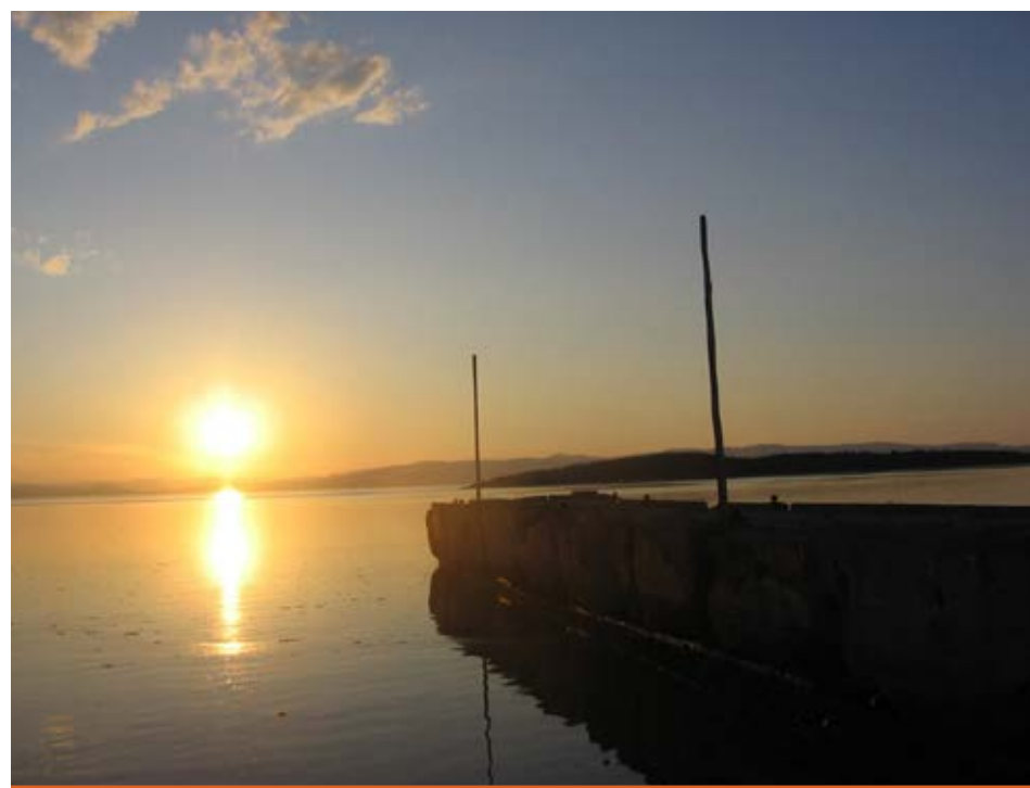
L'œuvre Tout en douceur , de Jacqueline Guimont, sera exposée jusqu'au 10 septembre dans le centre d'interprétation.

Pour obtenir des informations sur le Parc maritime: 418 828-9673 ou www.parcmaritime.ca