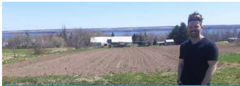
Philippe Deslauriers entend profiter de la pente vers le sud pour développer son vignoble à Saint-Laurent.

Le bâtiment sera restauré afin de pouvoir accueillir des touristes et leur faire vivre un moment festif dans une ambiance conviviale.