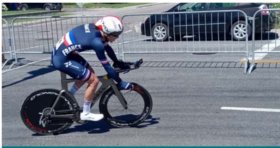
Les meilleurs athlètes de paracyclisme du monde sont débarqués récemment à Charlesbourg.

Voir pédaler à vive allure ces athlètes ayant des limitations physiques sur un parcours de 8,8 km, à Charlesbourg, sous une température parfois accablante, était vraiment spectaculaire. Ces sportifs nous en ont mis plein la vue avec leurs capacités impressionnantes à tourner les coins de rue comme si de rien n'était. J'ai vu des paracyclistes du Brésil, de l'Espagne, de la France, du Portugal, du Mexique, du Canada, des femmes et des hommes qui s'en donnaient à cœur joie à dévaler la pente rapide de l'avenue du Bourg-Royal avec leur chandail aux couleurs de leur pays.