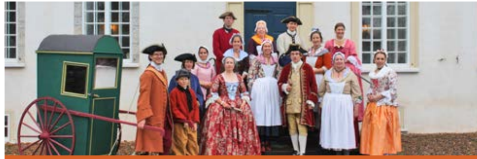
Les membres de la Société d'histoire In Memoriam et leurs invités devant le manoir lors de l'activité de la Société des dames.

reconstitution historique fut remplie de divertissements à la mode en 1750.