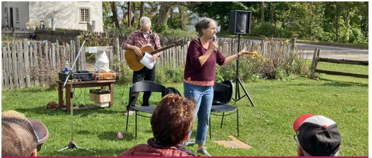
Les amateurs de contes et légendes se sont réunis au Manoir Mauvide-Genest.

Les activités inscrites à la programmation des Journées de la culture à l'île d'Orléans ont été concoctées par Ès TRAD, le Centre de valorisation du patrimoine vivant, de concert avec la MRC de L'Île-d'Orléans et ont été rendues possibles grâce au projet Les Rencontres Hydro-Québec des Journées de la culture.