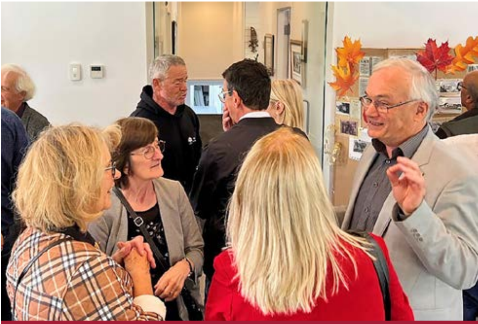
La municipalité de Sainte-Pétronille a souligné les 150 ans du village avec une fête à la salle de la mairie.

Dans le cadre du 150 e anniversaire du village de Sainte-Pétronille, s'est tenue, le 13 octobre, la fête en compagnie des membres du conseil municipal ainsi que la population présente pour échanger, fraterniser et surtout se rappeler de beaux et bons souvenirs avec des photos qui ont fragmenté un temps qui ne reviendra pas mais surtout une histoire capturée pour l'éternité et le tout agrémenté d'une musique d'ambiance qui a eu pour effet d'adoucir les mœurs.