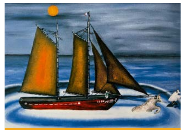
Illustration de Jean-Claude Dupont de la légende de la Pointe-aux-taureaux.