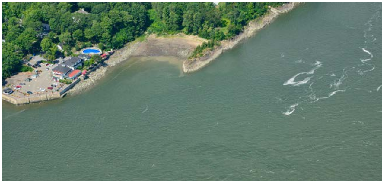
La pointe aux taureaux est située à l'extrémité de Sainte-Pétronille.

Le capitaine Noël, quant à lui, s'est remis de sa frayeur et a continué à naviguer sur les eaux du fleuve en évitant ce passage si dangereux, bien entendu.