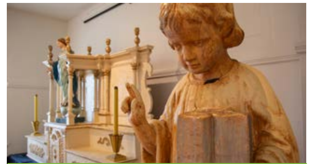
Deux des objets en vedette de l'exposition sur le patrimoine religieux présentée à la Maison de nos Aïeux.

L'exposition sera accessible aux visiteurs jusqu'à la fin de septembre 2025.