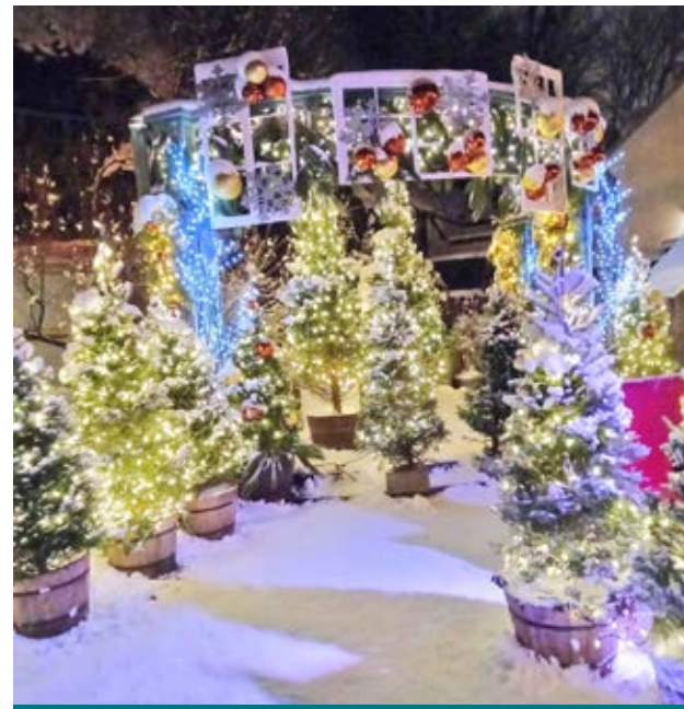
Il n'y a pas d'âge pour s'émerveiller de la magie de Noël.

Même si l'activité tire à sa fin, les vieux sont heureux d'avoir pu être de la fête. Ils retournent à leur appartement tout joyeux. Ils savent que leurs enfants, leurs petits-enfants et leurs arrière-petits-enfants viendront les chercher un peu plus tard pour célébrer.