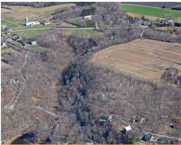
Le trou Saint-Patrice.

Le trou Saint-Patrice garde bien ses secrets... un autre trésor cependant vous y attend : c'est la Ferme Orléans qui depuis des années nous titille le palais avec ses produits de qualité.