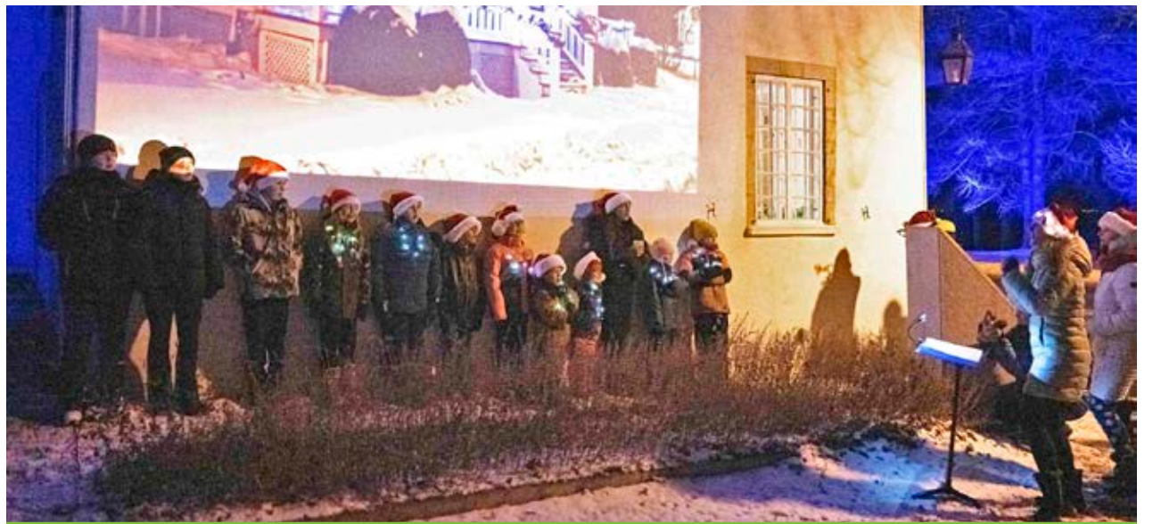
La chorale Les petites voix de l'île a interprété quelques chants de Noël devant le Manoir Mauvide-Genest dont l'un des murs sert d'écran à la projection de photos de Pierre Lahoud.

Voir autres photos sur autourdelile.com .