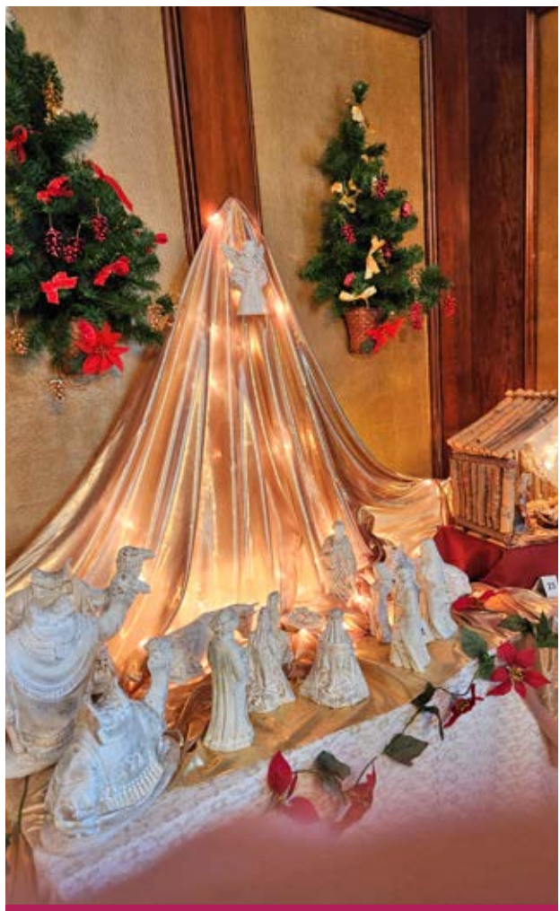
Les crèches constituent des œuvres d'art qui donnent le ton à la fête.

Voir autres photos sur autourdelile.com .