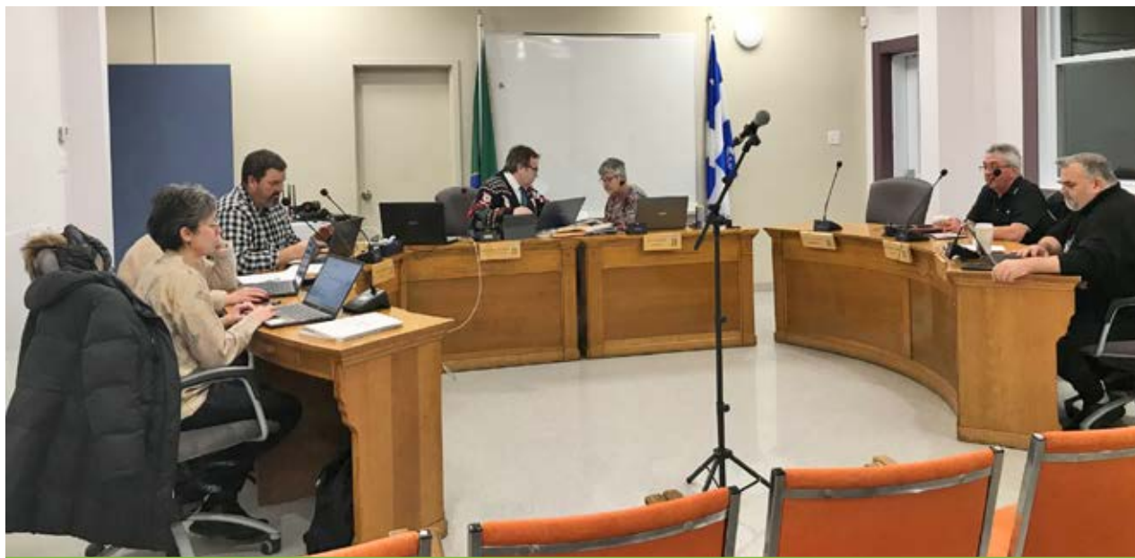
Le conseil municipal de Saint-François a adopté le règlement pour réduire sa taille de six à quatre conseillers à la séance du 9 décembre.

** Données arrondies fournies à titre indicatif; les valeurs fluctuent selon les sources et les années de référence.