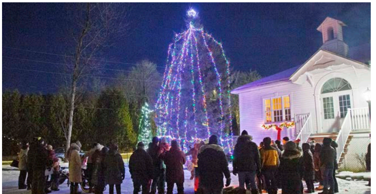
Les participants à l'illumination de l'arbre de Noël de Sainte-Pétronille ont entonné le traditionnel chant Mon beau sapin pour souligner l'événement.

Les enfants du village ont pu participer à un concours de coloriage d'un dessin d'un train de Noël. Trois prix ont été tirés au hasard.