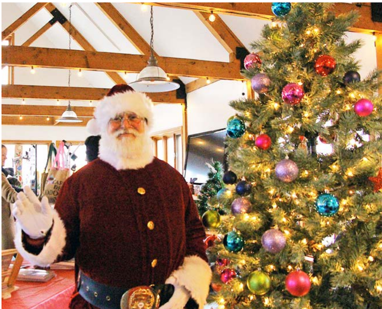
Le père Noël a fait le bonheur des jeunes et moins jeunes au Parcours artisanal et gourmand.

rapprochant la communauté. L'usine du père Noël, désormais fermée, rouvrira ses portes l'année prochaine pour de nouvelles célébrations magiques.