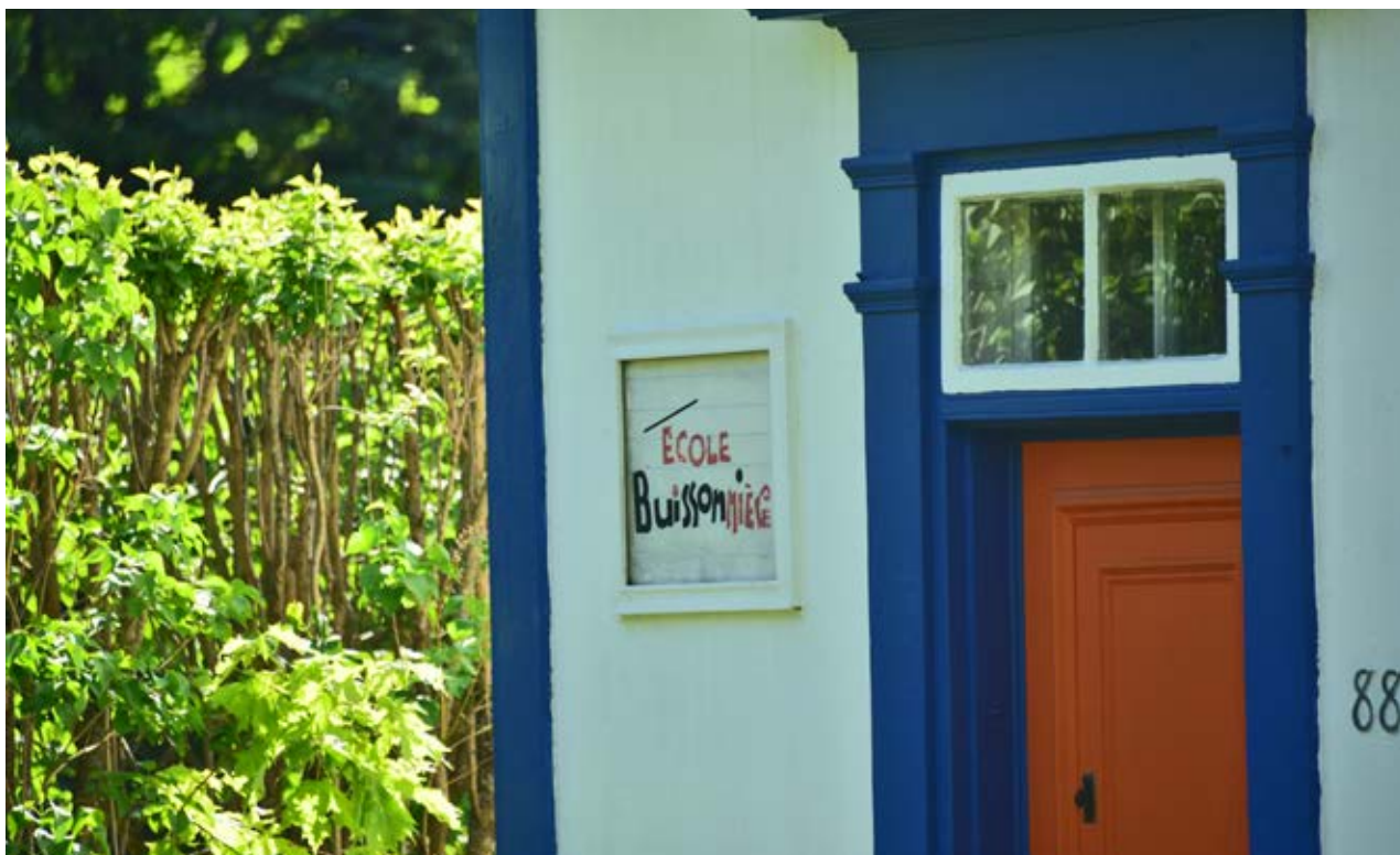
Exemple d'une école de rang à l'île d'Orléans.

Il y a encore sur le territoire orléanais plus de sept écoles de rang encore debout, dont une école de fabrique à Saint-François, construite en 1830, qui reprend la forme d'une grande habitation rurale et qui abritait également la salle des habitants.