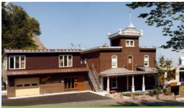
En 1975, la maison paternelle séparait les commerces de rembourrage de meubles et de vente de tapis.