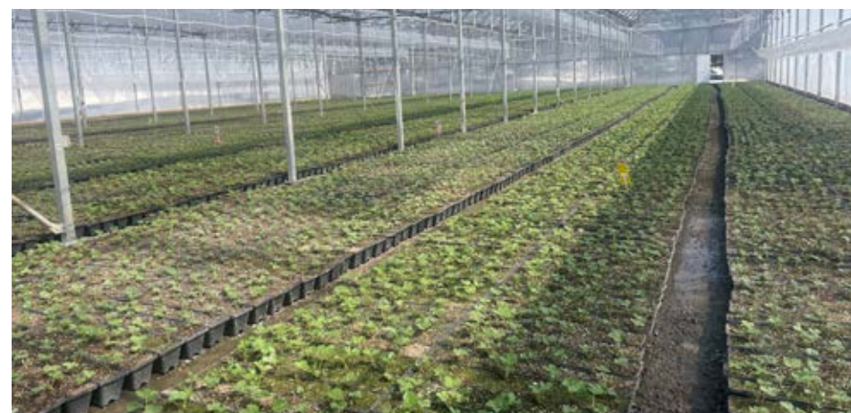
L'entreprise Les Fraises de l'Île d'Orléans est située à Saint-Laurent.

Le FRCN a été créé en vertu de la Loi accordant le statut de capitale nationale à la Ville de Québec et augmentant à ce titre son autonomie et ses pouvoirs. Pour les années 2020 à 2024, la Municipalité régionale de comté de L'Île-d'Orléans dispose d'une enveloppe de 1 363 874 $ provenant du Secrétariat à la Capitale-Nationale afin de soutenir financièrement des projets dont les retombées sont considérables sur le territoire.