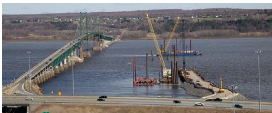
Jetée et barge de forage du côté nord.

Pour visionner le chantier en temps réel : Construction du nouveau pont de l'Île-d'Orléans à Québec | Gouvernement du Québec