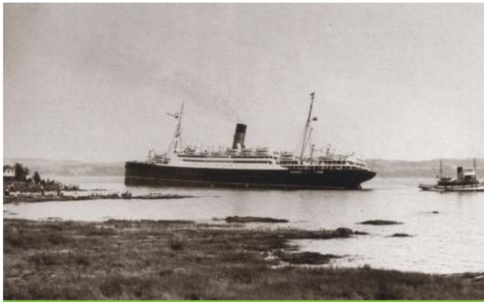
Le Franconia s'est échoué il y a 75 ans devant Sainte-Pétronille.