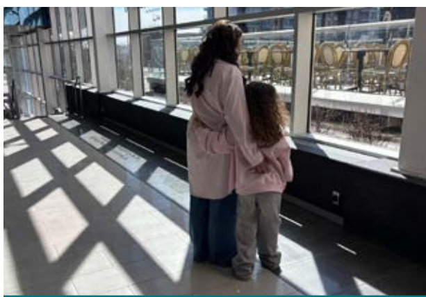
Une mère et sa fille, un lien intemporel.

Mais ce qui émeut le plus une mère, assurément, c'est l'esprit de famille qui se dégage de cette journée festive : l'ambiance, des échanges agréables,