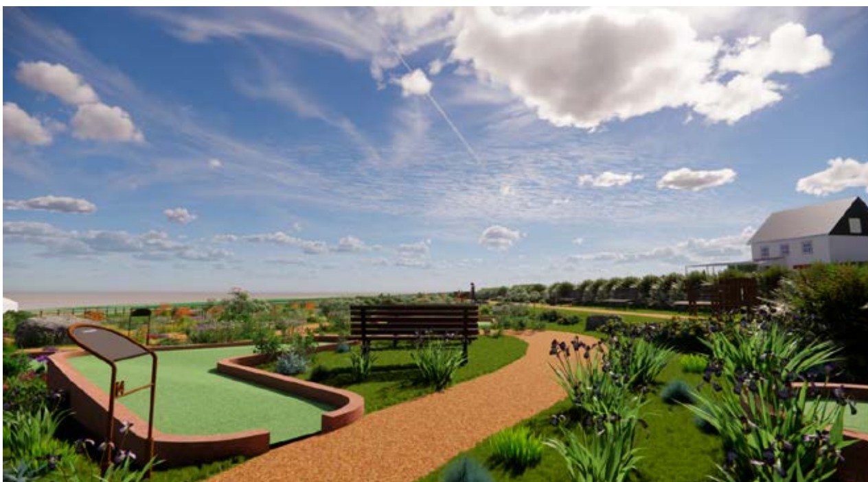
Les percées visuelles au fleuve seront maintenues dans le projet de minigolf.