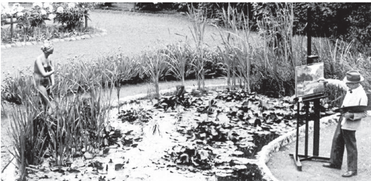
Horatio Walker en action dans son atelier.

Walker a passé une grande partie de sa vie orléanaise dans ce magnifique lieu. Il a illustré comme pas un la vie traditionnelle rurale de l'île d'Orléans. En ce sens, il a été un acteur privilégié de cette époque qu'il a réussi à nous transmettre par son art.