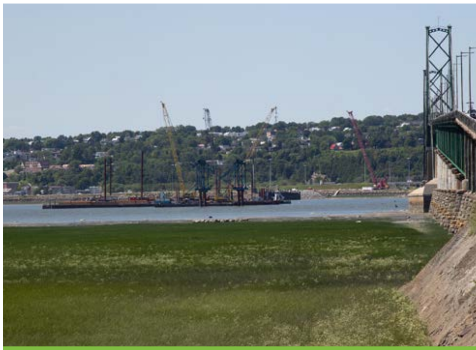
Les équipes procèdent au forage de pieux et à l'installation de planches d'acier pour la mise en place de l'estacade et des batardeaux.