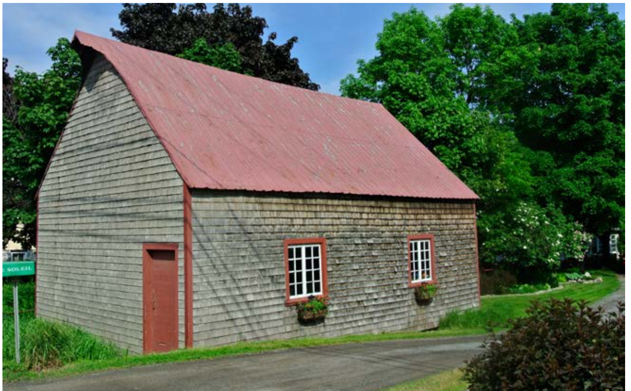
La chalouperie du Musée maritime de l'île d'Orléans.

l'extrémité de la poutre faîtière des intempéries. Un joli détail d'architecture que l'on se plaît à découvrir en marchant dans le village.