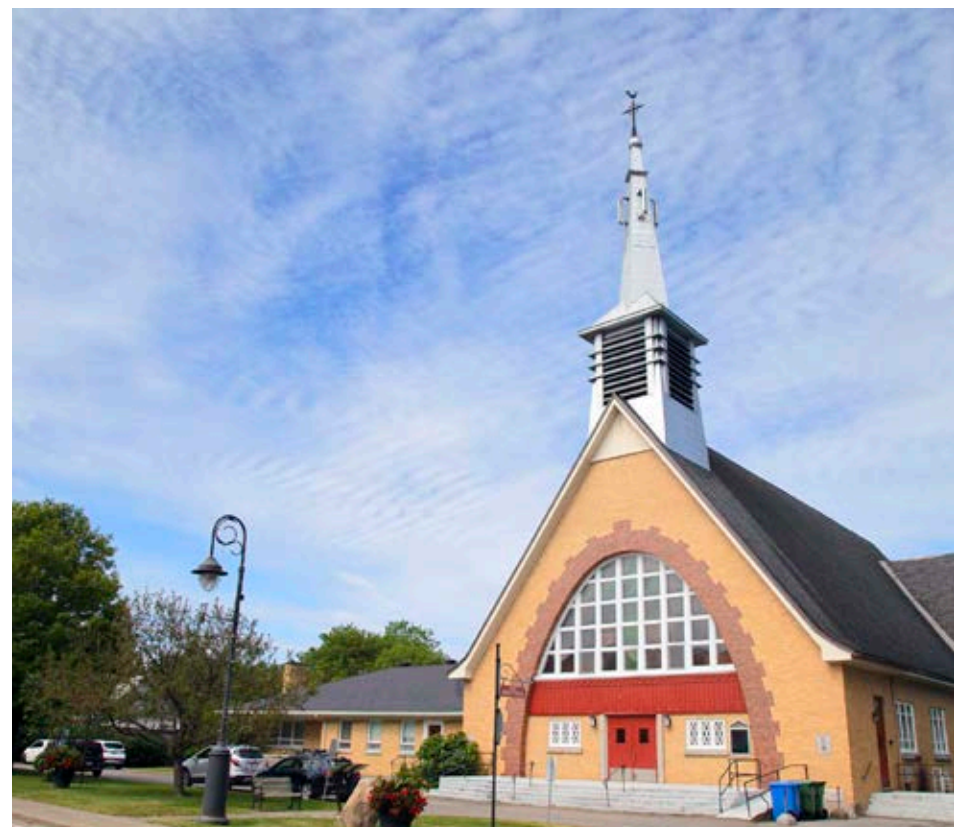
La nouvelle église de Saint-Pierre a célébré sa première messe le 30 octobre 1955.

clochers et les deux coqs, hissés à leurs sommets, veillent sur le passé et sur l'avenir du village.