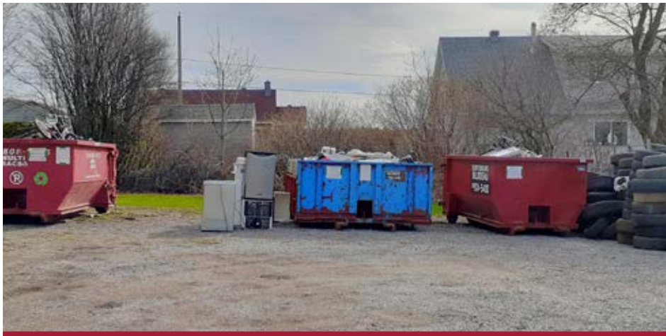
Le Mégarecyclage permettra de récupérer plusieurs tonnes de matières lors de l'événement du 2 mai prochain.

Visitez www.recupio.ca , section «Écocentre & Mégarecyclage», la page Facebook «Récup Île d'Orléans», ou contactez le 418 829-1011, poste 3, gmr@mrcio.qc.ca .