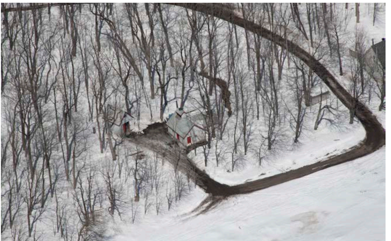
Cabane à sucre datant du début du XX e siècle, possiblement la plus ancienne sur le territoire.

et plusieurs sont construites sur le modèle des anciennes, mais plus petites. Quelques-unes sont situées en plein boisé, mais d'autres se trouvent sur le bord du chemin Royal et donc facilement accessibles.