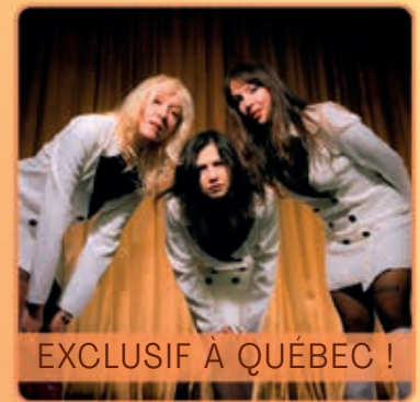
EXCLUSIF À QUÉBEC !