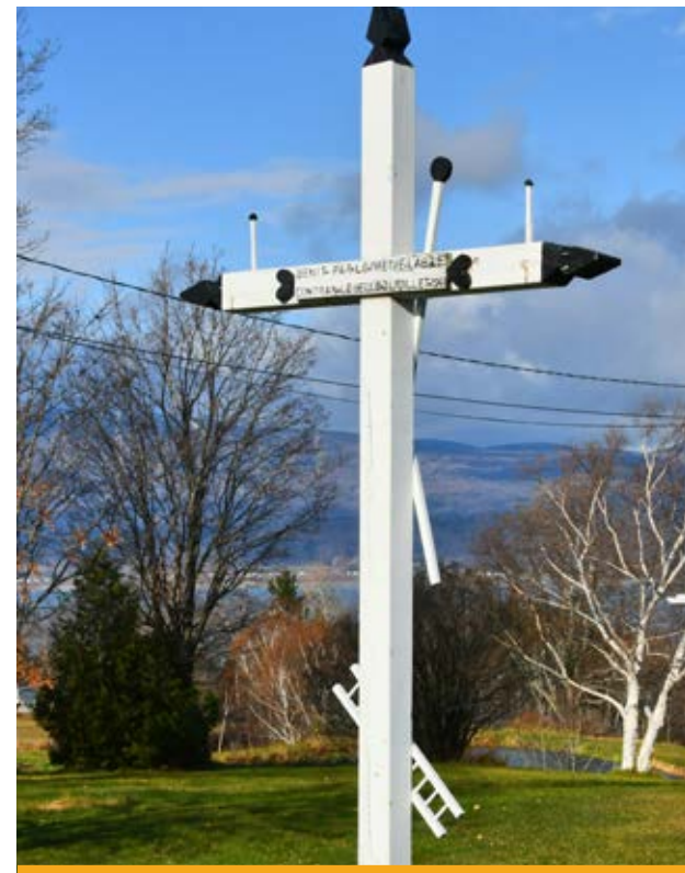
Les croix de chemin constituent un témoignage de la vie rurale d'autrefois.