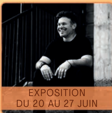
EXPOSITION DU 20 AU 27 JUIN