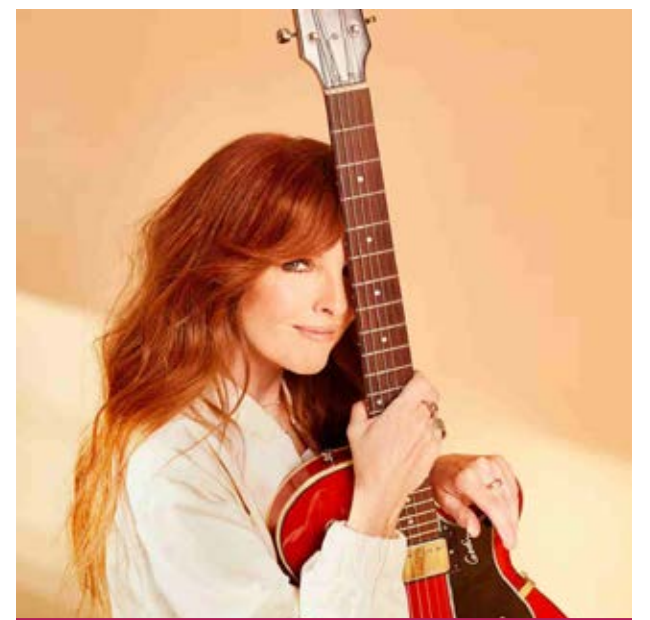
France D'Amour se produira le 5 novembre à l'Espace Félix-Leclerc.

Tous les spectacles débutent à 20 h. Pour réserver ou plus de renseignements : info@felixleclerc.com .