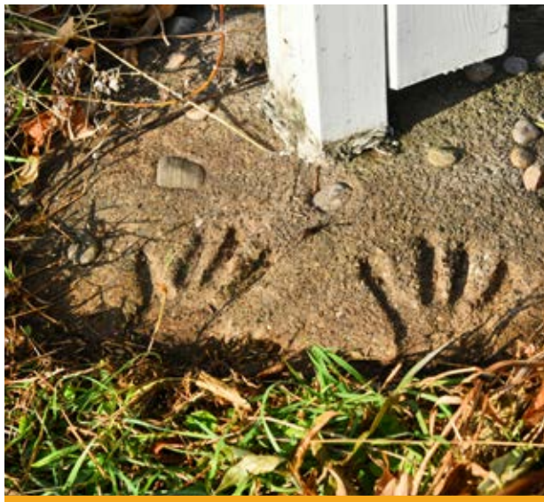
Empreinte des mains des constructeurs de la croix de chemin de la pointe d'Argentenay.

approchait de la frontière entre les Municipalités de Sainte-Famille et de Saint-Jean. Malheureusement, elle est aujourd'hui dans un état précaire: un mauvais travail de rétrocaveuse en a saccagé la base, et la barre horizontale vient de tomber. Il ne reste qu'à espérer qu'un comité d'embellissement s'en occupe, comme on l'a fait à Sainte-Pétronille.