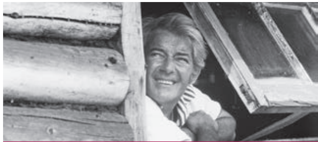
Résident de Saint-Pierre de 1969 à 1988, Félix Leclerc est considéré comme une figure fondatrice de la culture québécoise.

Félix, je me souviens se veut une conception scénique contemporaine regroupant musique, cirque, théâtre, illusion et vidéo, où 19 artistes, dont neuf musiciens rassemblés sur scène, feront voir les différents angles de la vie et de l'œuvre de celui qui a habité Saint-Pierre de 1969 jusqu'à son décès le 8 août 1988.